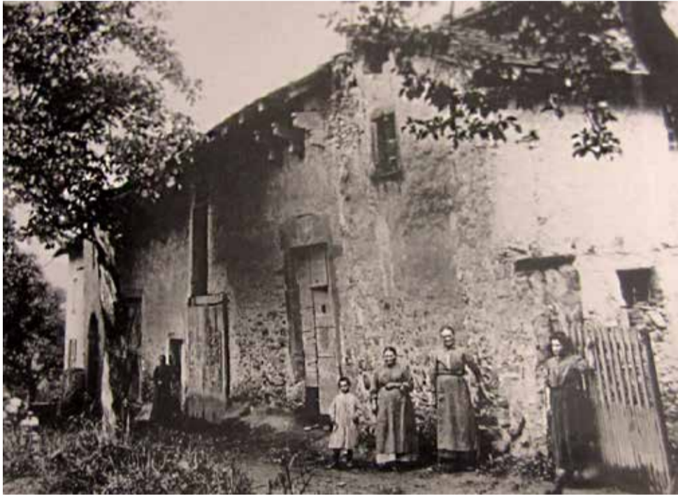
Femme de Saint-Maximin devant l'ancien prieuré Clunisien, (1900-1925).

une offre de logement suffisante en nombre et en diversité, pérenniser l'activité agricole et l'exploitation forestière, valoriser et développer les activités culturelles et touristiques (notamment autour des fêtes de village), promouvoir la qualité de vie en préservant les caractéristiques du village. Bref, Saint-Maximin dessine un urbanisme durable et peu gourmand en espace, tout en développant ses réseaux d'eau potable et d'assainissement, ses réseaux de transport, en veillant au renforcement des équipements et des services publics. Bref, le village doit rester attractif.