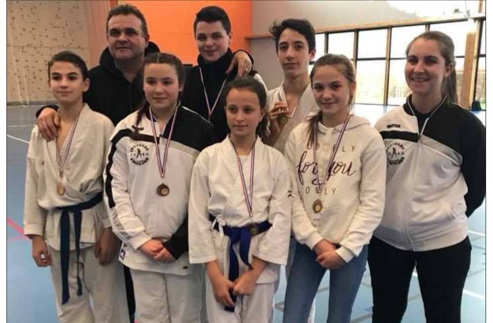
Avec ces sept nouvelles médailles, la saison du SKCP se poursuit parfaitement.