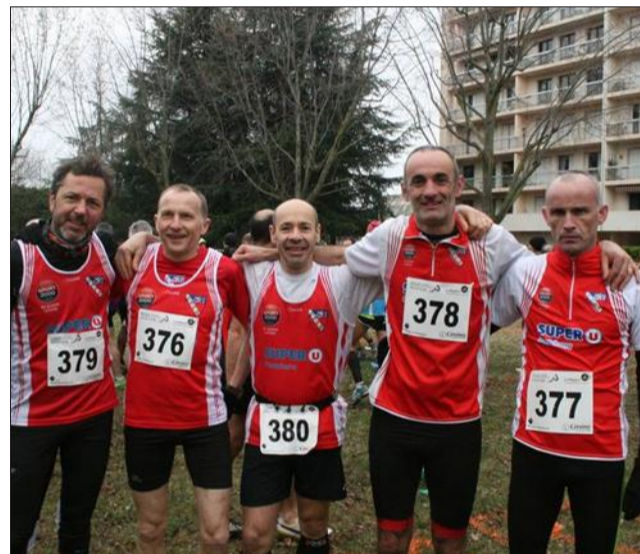
L'équipe Masters du CAPR-G est passée tout près d'une qualification pour les 1/2 finales du championnat de France.

Dimanche, c'est à Valence, dans la Drôme, que les athlètes du Club athlétique Pontcharra La Rochette-Grésivaudan avaient rendez-vous pour le compte de la deuxième étape de la saison des championnats de cross-country, les 1/4 de finale des championnats de France également appelés championnats Pré-régionaux.