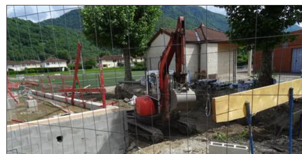
Des aménagements sont réalisés à proximité de la buvette.

Ce lundi, le chantier de construction du bâtiment qui jouxte le gymnase municipal a encore pris de l'extension. En plus du bâtiment proprement dit, les entreprises de terrassement ont également creusé les abords de la buvette du football afin de redonner un espace bien plat et de refaire le petit muret de soutènement qui sert de gradin aux supporters du club. Parallèlement, les feuilles de chaque côté du bâtiment sont en train d'être comblées et tassées après avoir imperméabilisé les murs, et lors de notre visite, l'espace entre le gymnase et la salle des fêtes était également entré en phase finale beaucoup plus compliquée avec tous les écoulements et autres servitudes. Rappelons que ce chantier devrait durer jusqu'à la fin de l'année. Tout a été fait pour assurer une grande solidité et un bon isolement du nouveau bâtiment.