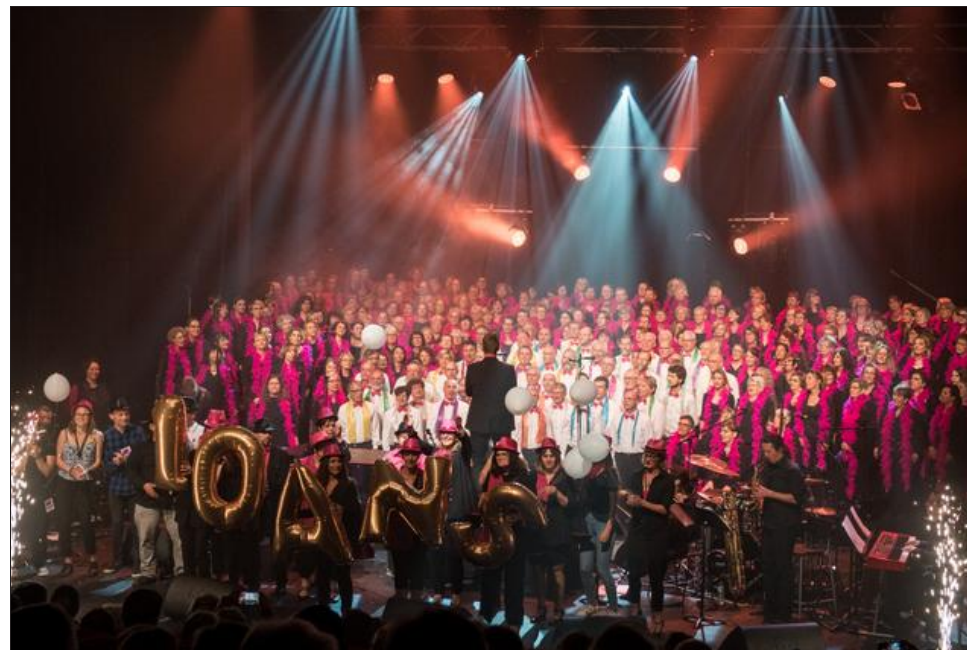
Le concert a eu lieu samedi devant une salle comble.