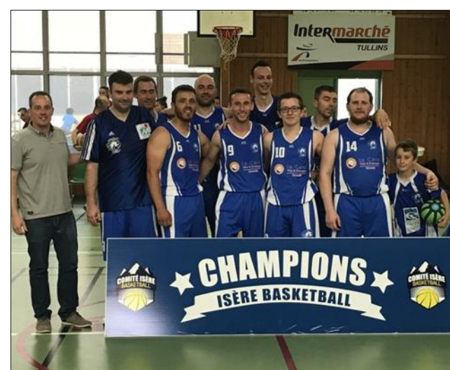
Les Goncelinois ont remporté le match de clôture de leur saison.