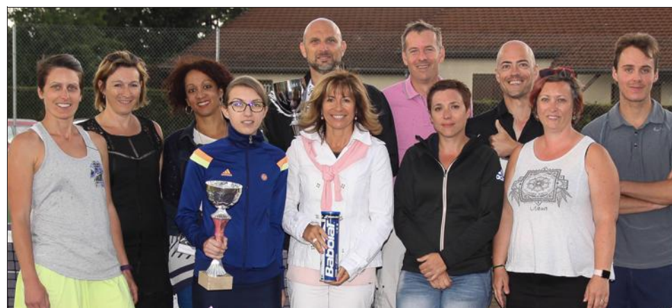
Le tournoi s'est terminé le 19 mai.

Du 5 au 19 mai s'est déroulé le premier tournoi de tennis du club de Froges (TCF). Une compétition qui était ouverte aux joueurs de niveau NC à 15. L'objectif des dirigeants du TCF était d'atteindre la centaine d'inscrits. Un objectif atteint puisque ce sont 102 joueurs qui se sont présentés, avec 7 "wo" (forfaits), 75 hommes de NC à 15 et 25 femmes NC à 15/5.