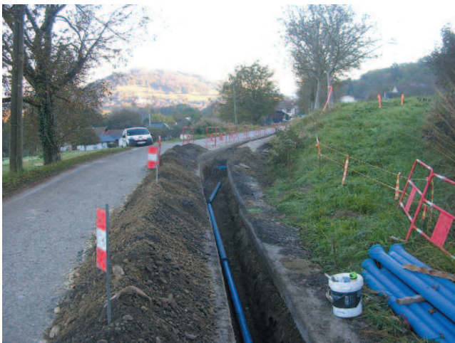
Vue de chantier de La Serve au moment de l'enfouissement des réseaux

Coût de l'opération : 331 500 € (dont 45 000 € de clôtures et portails des captages) financés en partie par le département et l'agence de l'eau.