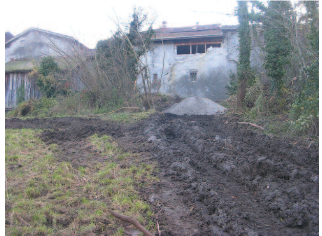
Partie haute du raccordement réalisé

Nous rappelons à tous les propriétaires qui bénéfi-